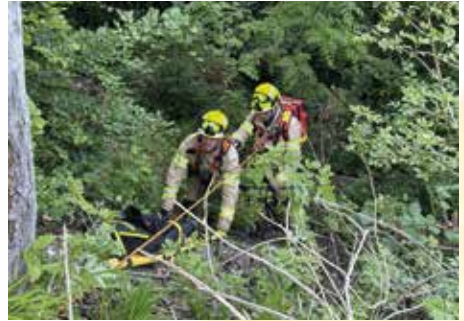
Oben: Das Hagerer Team Absturzsicherung im Einsatz. Unten: Die Fahrzeuge der Ortsfeuerwehr Hagen

Team ELW, Team Türöffnung, Team Wasserrettung, Team Abstusi, Team Drohne, CBRN, ESH