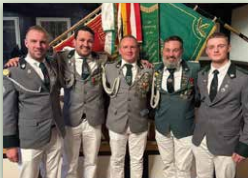
Neues Offizierskorps Schwalenberg.