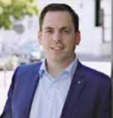
Torben Blome Bürgermeister