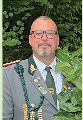
Kronprinz S. Richold.

■ GRABMALE ■ EINFASSUNGEN ■ RESTAURATIONEN