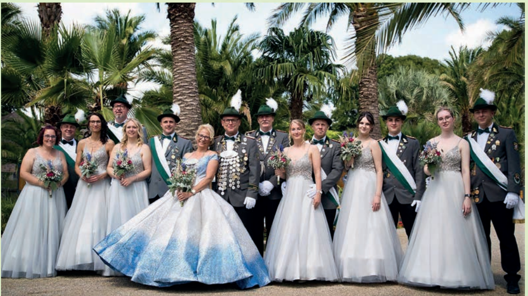
Holzhäuser Königsgesellschaft 2024/2025

Party mit der bekannten Partyband „Crossfader“, die wieder für super Stimmung im Festzelt sorgen wird.