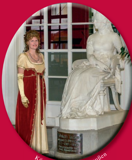
Königin Luise von Preußen

Kostenfreier Zugang an allen 3 Tagen im Kurpark vom 4. bis 6. Juli