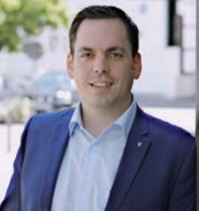
Torben Blome Bürgermeister