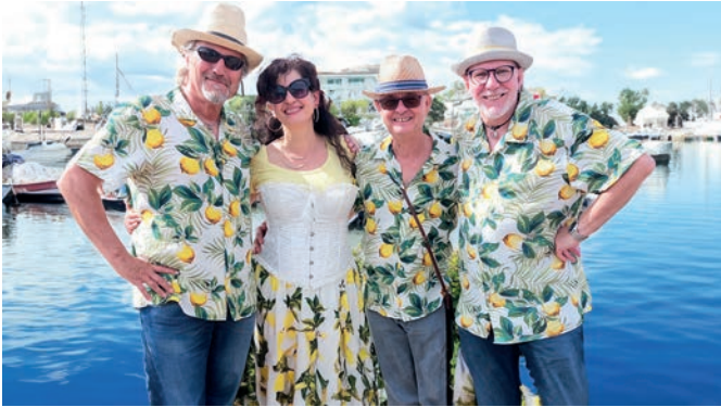
Flori's Lemon Bar aus Bergkamen